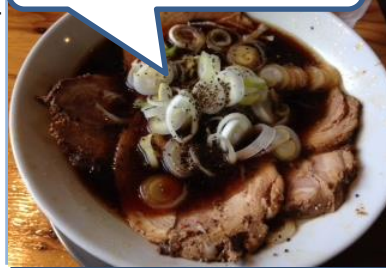
<高速での雪対策のマーキング>