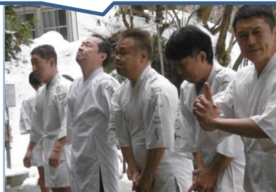
<寒い中でもハイ! チーズ^^>