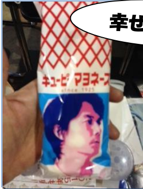
<キュービーマヨネーズ>